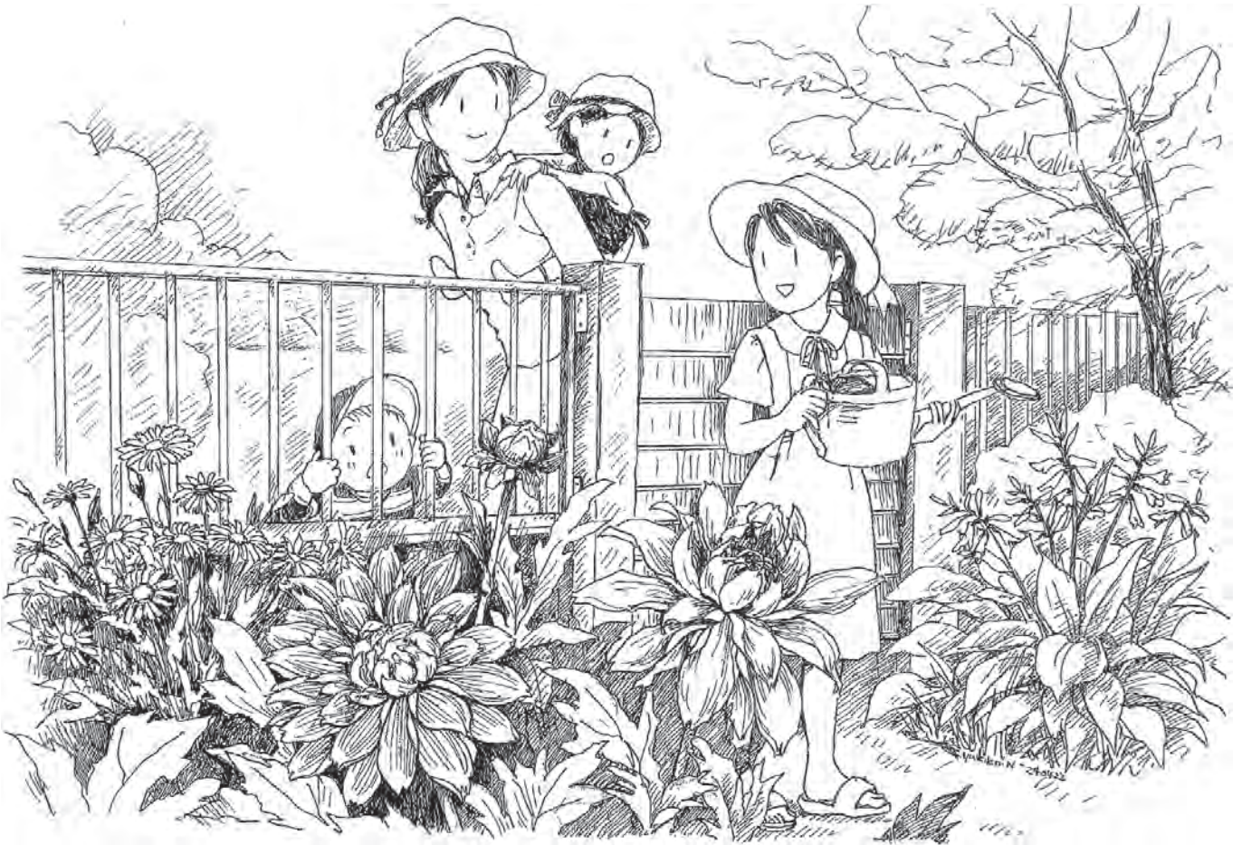
「ダリアに見惚れて」

●年間聖句 何事も愛をもって行いなさい。(コリント信徒への手紙16章14節より)